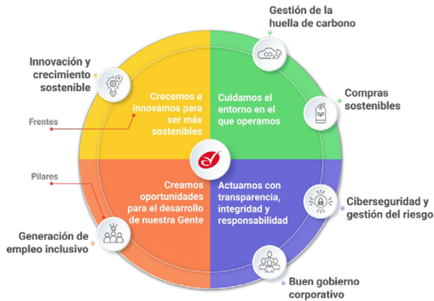
Gráfico 1: Modelo de Sostenibilidad AV Villas